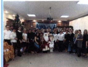
Торжественное собрание членов трудового коллектива

В завершении праздника всех гостей ждал удивительный подарок: путешествие в сказочное королевство накануне нового года.